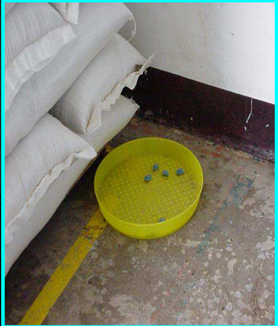
การควบคุมและกำจัดสัตว์พาหะ