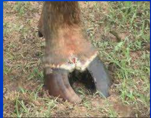
โรคปากและเท้าเปื่อย