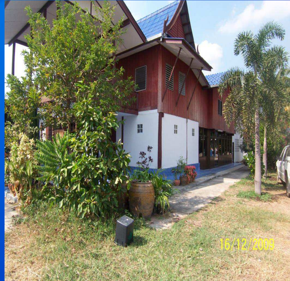
1.2.4 พื้นที่การเลี้ยงแยกเป็นสัดส่วนจากที่พักอาศัย (ข้อเสนอแนะ)